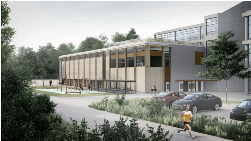
Figur 1 - Illustrasjon Bygg F - Godalen vgs

Backe Rogaland AS er engasjert av Rogaland fylkeskommune for å bygge utvidelsen av Godalen videregående skole. Bygg F vil bestå av gymsal, garderober og styrketreningsrom.